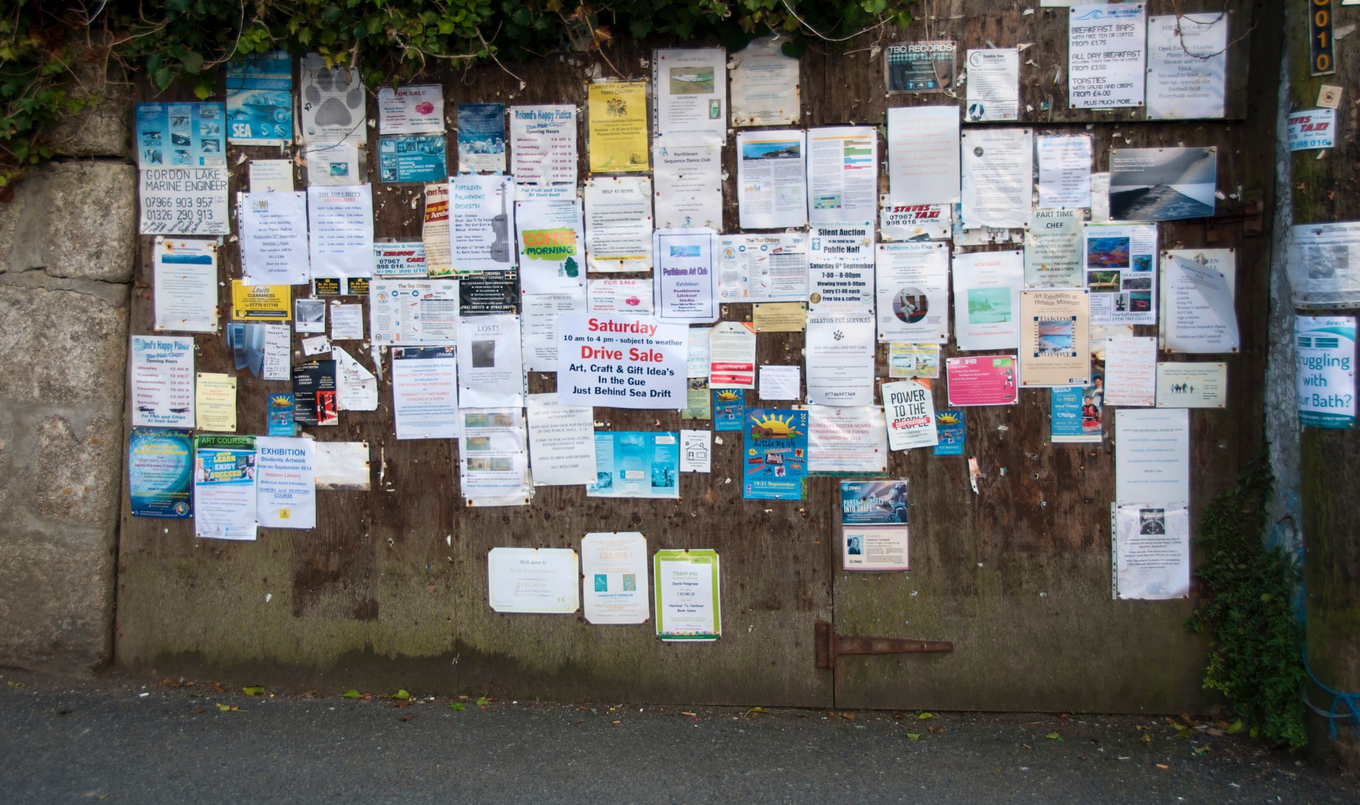
2007 - Noticeboard scandal